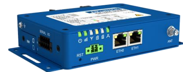
ICR-3211B LTE ルータ

ICR-3211B は、そのほかの LTE ルータと同様に WebAccess/DMP という遠隔監視・管理サービスに対応しています。ルータにインストールされている DMP ソフトを有効にして、クラウドの WebAccess/DMP でルータを登録すると、通信状態、通信量などのステータスを確認したり、リモートでコンフィグを変更したりすることができます。5 台まで無料で使用することができます。