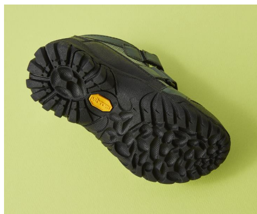
（モデル名）「クーガーキッズ」 ヴィブラム「XS TREK EVO」

グリップ力と耐久力の確かな性能と、デザイン性にもこだわっている「Vibram」のアウトソールを搭載したアイテムが、IFMEから初登場。「IFME Vibramソールダブルベルトハイキングスニーカー」は“市販の子ども用ハイキングシューズは重くて履かせられない”というお客様の声に応え開発。一般的なハイキングシューズよりも軽量でありながら、高いグリップ力と泥詰まり防止構造で、様々な場面で高い滑り止め効果を発揮します。また、摩耗に強い特別なゴム素材を使用することで高い耐久性を誇り、ハイキングや登山などの過酷な環境下でも信頼性に優れています。さらに、適切な厚みや柔軟性を備えた設計により、歩行時の衝撃を吸収し、足への負担を軽減するため、お子様が長時間履いても疲れにくい構造となっています。