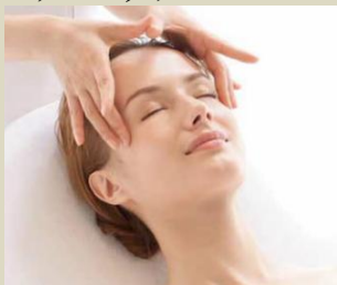
オーキデ インテンシヴ トリートメント 80分×3回