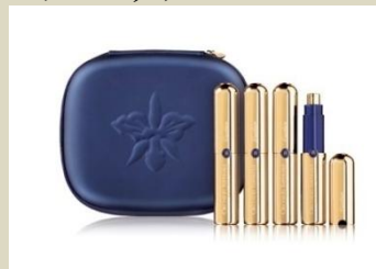
オーキデ アンペリアル ザ トリートメント 15ml×4本