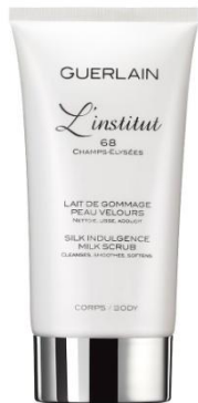
ボディライン スクラブ 150ml 9,975円(税込)