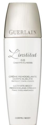
ボディライン クリーム 200ml 15,750円(税込)