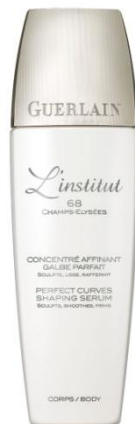
ボディライン セロム 200ml 18,900円(税込)