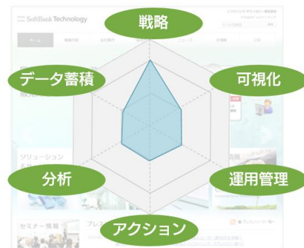
調査結果サマリーの例