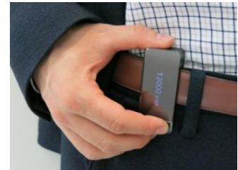
本プロジェクトに用いる IoT デバイス