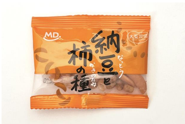
個包装(納豆と柿の種)

納豆はタンパク質や腸内環境を整える納豆菌を豊富に含み、日常的に食べることで免疫力サポートにも寄与します。当社の「大豆習慣」シリーズは国産大豆を100%使用し、納豆を日々の生活に簡単に取り入れられるように開発した商品です。便利な個包装タイプで、シンプルな納豆のみの「大豆習慣クリスピー小粒納豆(だし醤油、うす塩、梅しそ)」、ヘルシーな自然素材とミックスした「大豆習慣納豆おくら、小魚、さば」、そして今回発売するスナック感覚で食べやすい柿の種とミックスした「大豆習慣納豆と柿の種」「大豆習慣梅しそ納豆と柿の種」と、3種の異なるラインナップをそろえており、豊富なラインアップから気分や食シーンに合わせて選ぶことができます。