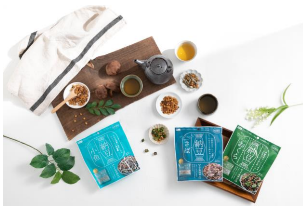
大豆習慣シリーズの商品(一部)