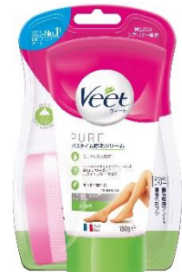
しっかり除毛 販売名: