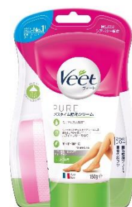
しっかり除毛 販売名：