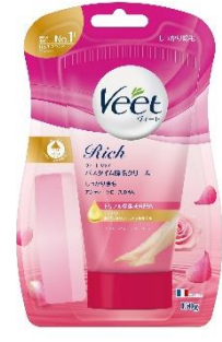
しっかり除毛 販売名：