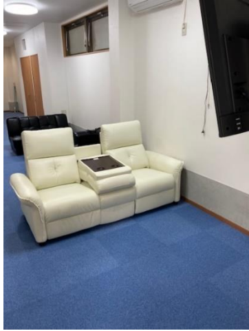
ソファで映画等を鑑賞いただけます