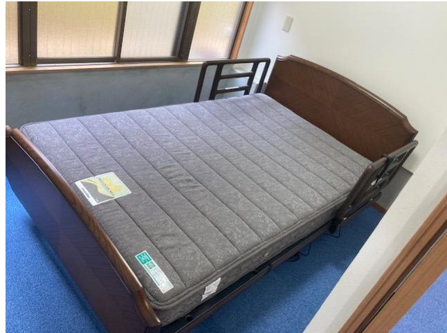
寝具（フランスベッドグランマックス3モーターセミダブル使用）