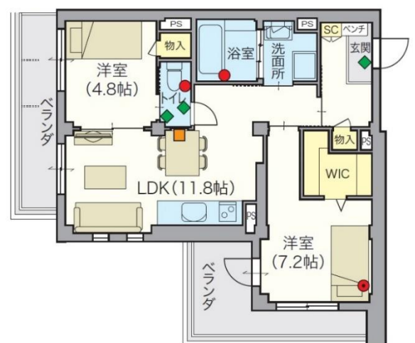
住戸例 (2LDK: 57.53 m 2 )

凡例： ■ みまもりサポート コントローラー ● 緊急通報ボタン ● 緊急通報ボタン (ペンダント型) ◆ ライフリズムセンサー