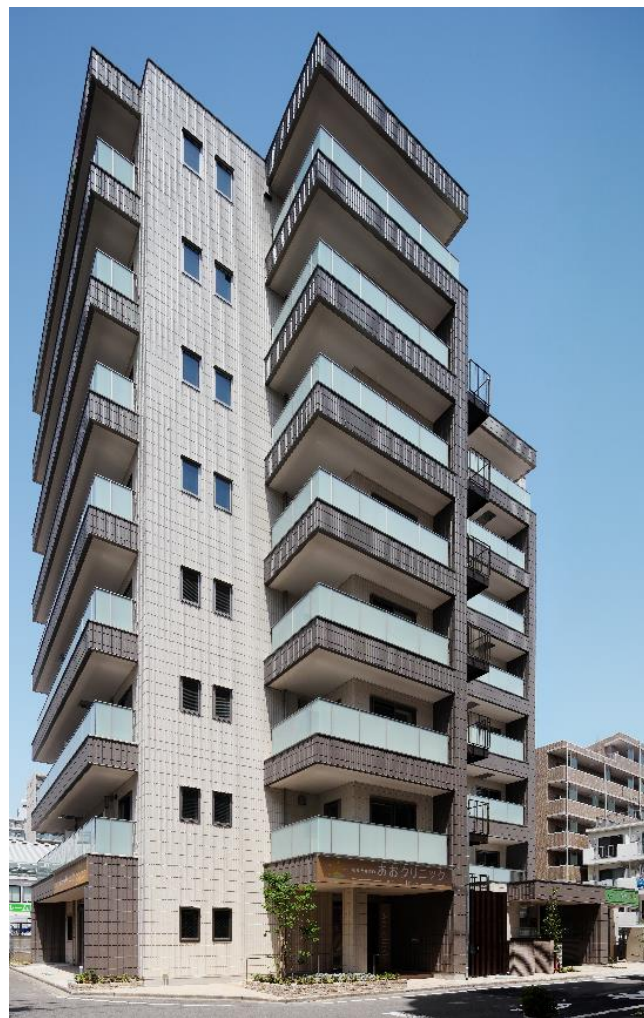
「ヘーベル Village 相模大野」外観

当社は今後も立地条件や周辺環境を考慮した企画で、オーナーと入居者への提供価値の向上に主眼をおいた事業展開を推進してまいります。