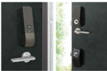
②スマートロック付きドア

※ 1 本サービスは、旭化成ホームズのインターネットサービス「へーベル光」のオプションサービスとなります。