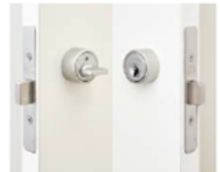
④内鍵付き室内ドア