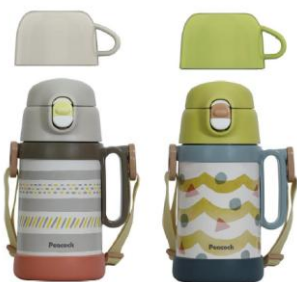
グレー (H) イエロー (Y) 容量: 0.5L

現在も販売して人気の高い直飲み型&コップ型の2way「ASN-W50」北欧テイストを継続したデザイン。