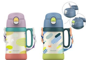
SORA (SR) KAWA (KW)