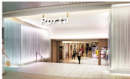
南エリア エントランスイメージ

伝統ある丹後ちりめんを使用した意匠が新たに登場! 京都の伝統を感じながら、明るく、 快適な空間をご用意しています!