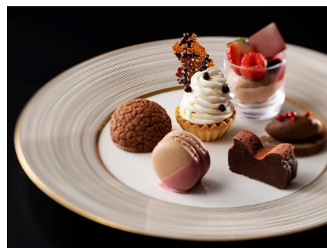
THE SWEETS !