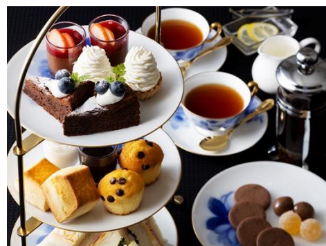
アフタヌーンティーセット