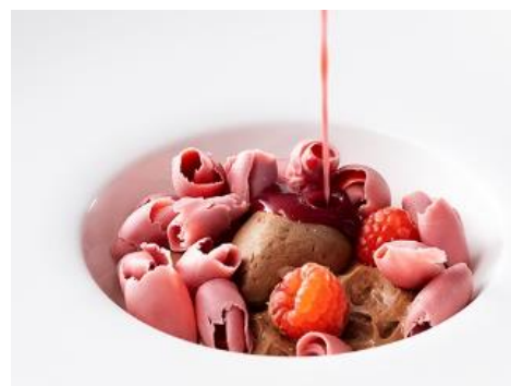
ムース・オ・ショコラ

・提供時間：11:30～14:30(L.O.)／17:00～20:30(L.O.)