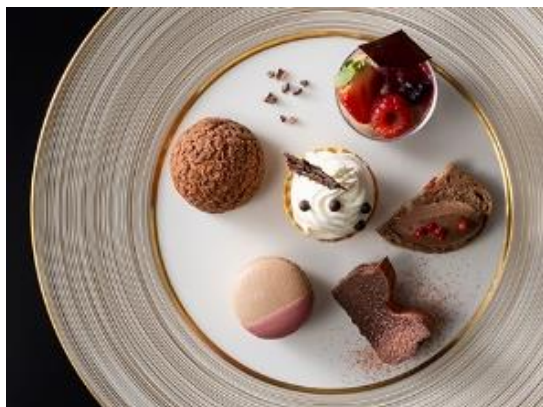
THE SWEETS !