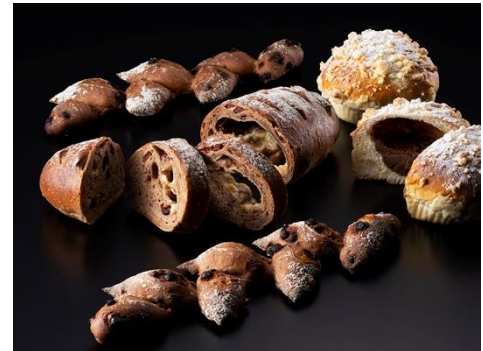
2月のブレッド各種