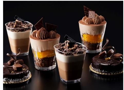
2月のスイーツ各種