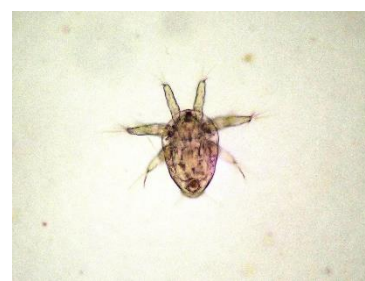
ノープリウス幼生