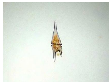
赤潮の原因にもなる ケラチウム・フルカ

※新型コロナウイルス感染拡大の状況や生きもの状態により、変更や中止となる場合がございます。