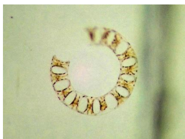
ハシゴケイソウの仲間