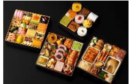
レストランコラボレーションおせち