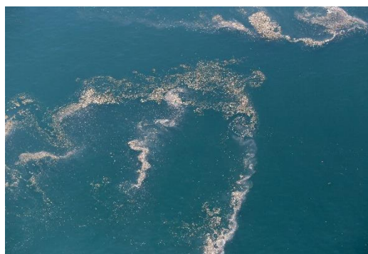
台風後の浮遊ゴミ