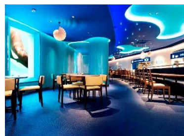
レストラン「オーシャン」