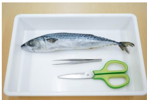
解剖に使用するマサバと道具