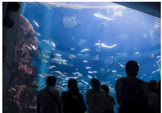
夜は体色に変化する魚も