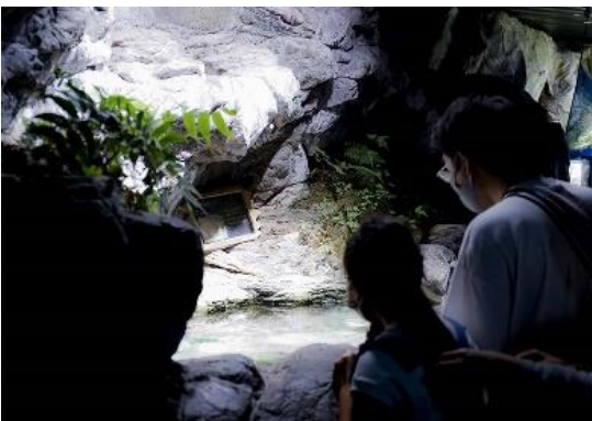
夜も灯る照明の秘密