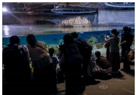
昼と夜では魚の数が？