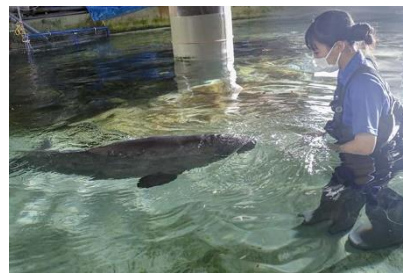
飼育員とのリハビリの様子