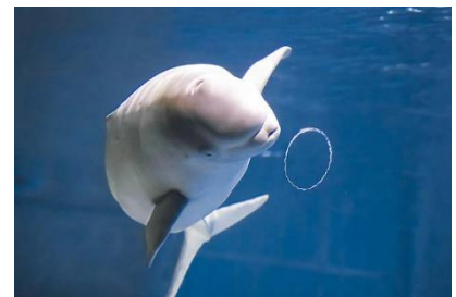
バブルリングで遊ぶ「ヴィズ」