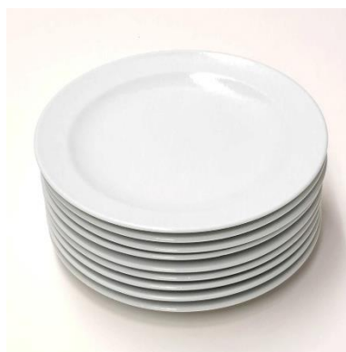
蘇生後の食器 裏印 Repaired by ogiso

株式会社おぎそ 公式サイト https://www.k-ogiso.co.jp/