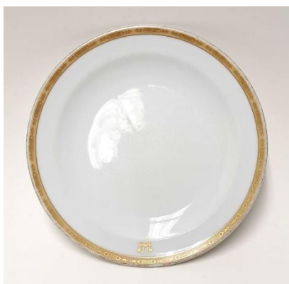
蘇生前の食器 裏印 食器メーカーブランド

今回は、古くからホテル内の宴会場で使用していたデザート皿を段階的にリペアし、今年度内に合計1,000枚を蘇らせます。再生後は、ホテル内レストラン「テラスレストラン ピアレ」の朝食時に、お客様の取り皿として使用いたします。料理は地産地消を心掛け、北海道の大地の恵みを受けた食材を使用しておりますが、その料理を彩る食器もサステナブルであることを推進し、地球環境をより深く考えたホテルづくりに注力してまいります。