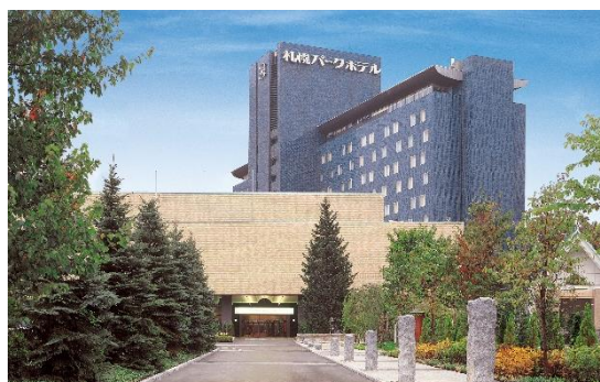
札幌パークホテル外観

札幌パークホテルは、地球環境とずっと深く「つながる」ため、持続可能な未来の実現に向けて、自社農園「グランビスタファーム サッポロ」の運営や都市型養蜂、キャストへのサステナブル研修、食材ロスを減らす従業員食堂の自営化など、さまざまなアプローチでサステナブルな活動を行っております。