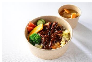
兵庫 B 級グルメ ビーフカツめし