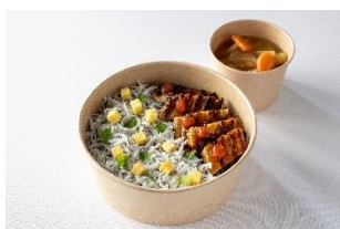
瀬戸内しらすと焼きあなご丼