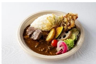
神戸ビーフカレーと彩り野菜