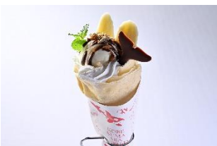
杏仁豆腐マンゴークレープ