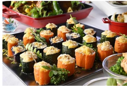
季節野菜の器で瀬戸内しらすのキッシュ