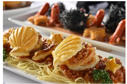
淡路玉葱のミートソース 貝殻パイおかきの宝石