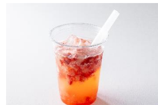
ナタデココ入りフルーツソーダ