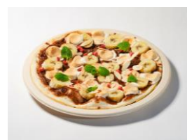
チョコバナナのピザ