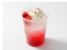
いちごクリームソーダ