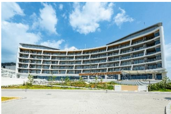
神戸須磨シーワールドホテル 外観