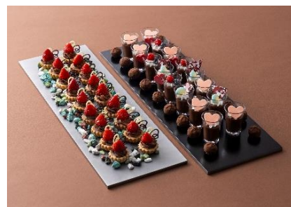
イチゴのチョコタルト・トリュフ・ ハートのチョコムース