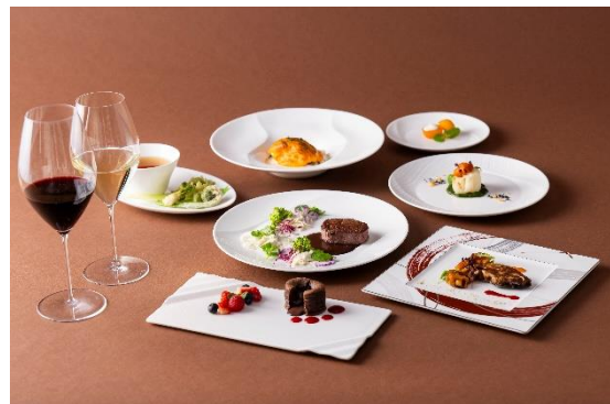
バレンタイン特別ディナーコース