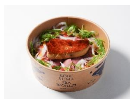
ローストビーフとフォアグラの ロッシェニ丼