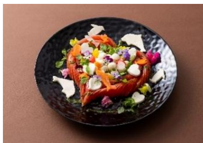
ハートのカプレーゼ