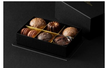
バレンタインボックス