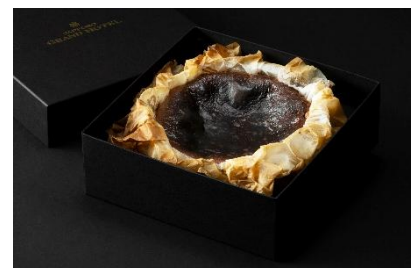
バスクチーズケーキ ショコラ ホール