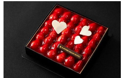
ルージュ ディヴェール