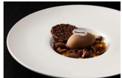
クープ・ドウ・ショコラ with ハーゲンダッツ