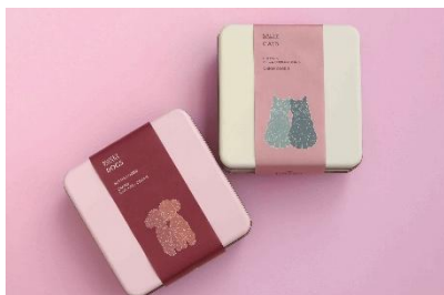
オリジナルクッキー缶 バレンタインエディション