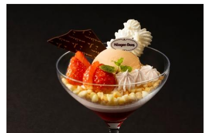
キャラメルアイスクリームと苺のパフェ with ハーゲンダッツ