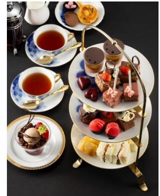
アフタヌーンティーセット