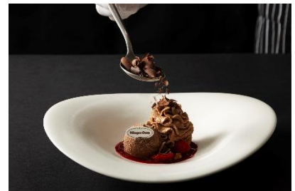
ムース・オ・ショコラ with ハーゲンダッツ

ムースショコラとオレンジソース、フルーツのダイスやカカオニブを散りばめ、ミルクチョコレートアイスクリームで仕上げました。