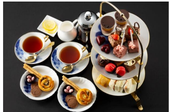
アフタヌーンティーセット

ザ・ベーカリー & ペイストリーでは、宝石のように苺を敷き詰めた華やかなチーズケーキ「ルージュ ディヴェール」をはじめ、4 種類のショコラを詰め合わせた「バレンタインボックス」などギフトにぴったりのスイーツを販売いたします。また、ノーザンテラスダイナーのスイーツバイキングでは、ショコラをテーマに、今年新たに登場したライブクッキングメニューとして「ムース・オ・ショコラ with ハーゲンダッツ」をご提供するなど、バラエティー豊かなスイーツを食べ放題でお楽しみいただけます。ロビーラウンジミゼールでは、ショコラをテーマにした人気のアフタヌーンティーセットのほか、「チョコレートとベリーのパフェ」をご用意しております。