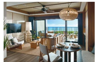
スーペリアスイート