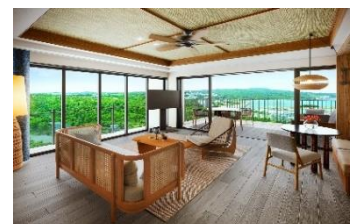
コーナープレミアムスイート