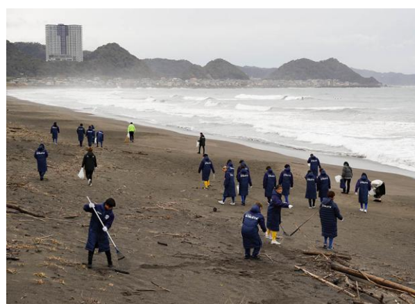
地元企業によるビーチクリーン活動