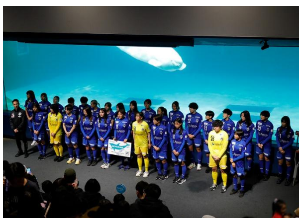
オルカ鴨川 FC への年間パスポート贈呈