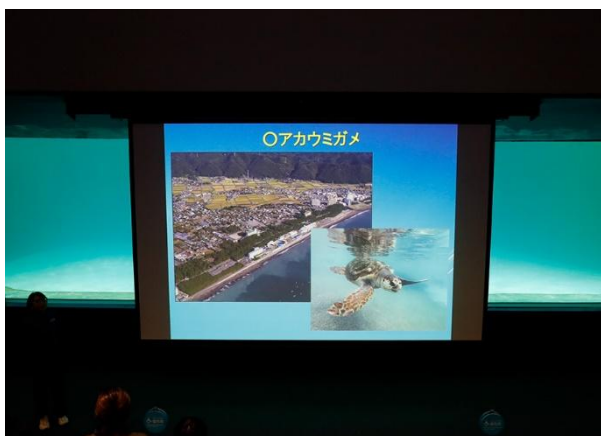
飼育員による動物レクチャー