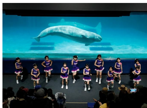
ORCAS☆ダンスパフォーマンス