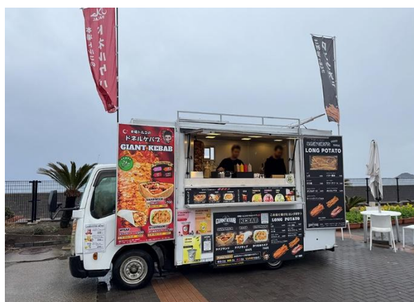
地元物産品の露店販売