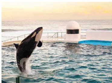
・『Special Night with Orca』