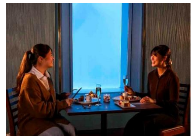
・レストランでのセミコースディナー