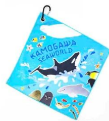
・オリジナル くつつタオル①