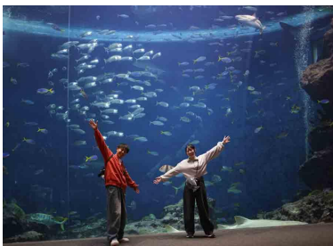
・「無限の海」グループ記念写真

参加特典として、隣接する駐車場の確保 ※1 や当日の1Dayチケットが含まれており、一日を通して鴨川シーワールドを満喫することも可能です。さらに参加者の皆様には、ペットボトルの持ち運びなど、さまざまなシーンで活躍する新商品「くつつタオル」をプレゼントします。