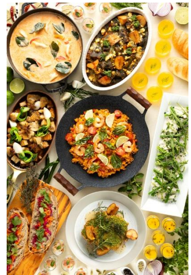
ランチバイキング