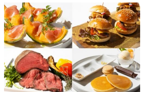
お盆期間限定 スペシャルランチバイキング