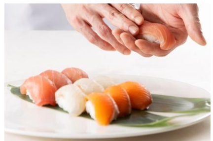
写真左：北海道産黒毛和牛のローストビーフ 中：有頭海老の鉄板ガーリックシュリンプ 右：握り寿司