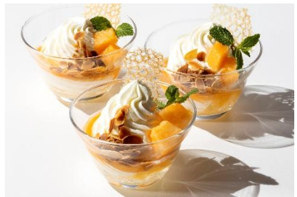
写真左：屋台風いちご飴とチョコバナナ 中：メロンのショートケーキ 右：北海道産メロンのミニパフェ