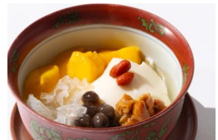
マンゴーと黒タピオカ入り豆花