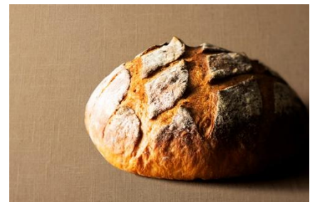
パンドカンパーニュ