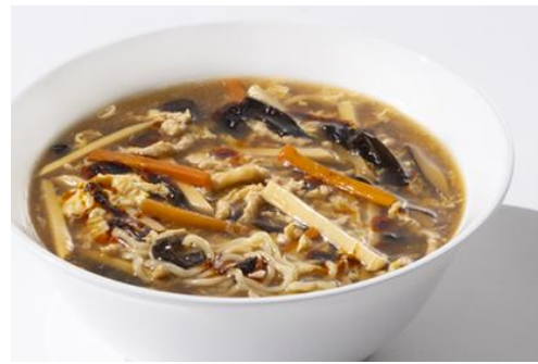
チャイニーズダイニング黄鶴「台湾料理フェア」

ノーザンテラスダイナーの「ランチバイキング」「ディナーバイキング」では、世界一周の旅をテーマに、各国の料理が集うバイキングをご用意しております。グルメな街歩きを愉しむように、お好きな料理をご堪能ください。また、ラウンジ・バー・オールドサルーン 1934 では、人気プラン「フリーヴルプラン」にて、7月は「ヨーロッパ」、8月は「ハワイ」をテーマにしたオードブル食べ放題をお愉しみいただけます。カクテルを含むフリードリンクとともに異国気分をご堪能ください。チャイニーズダイニング黄鶴では、「台湾料理フェア」と題し、賑やかな夜市を思わせる一品料理をご提供いたします。