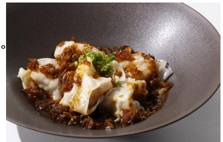
海老雲吞の揚げエシャロット入りピリ辛ソースがけ