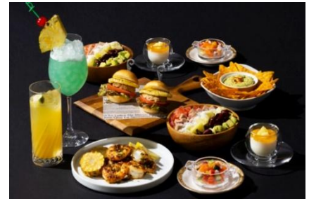
8 月フリーヴルプラン

・夏野菜のロミロミサーモン ・ハワイアンパイナップルバーガー ・ハニーマスタードモチコチキン 他