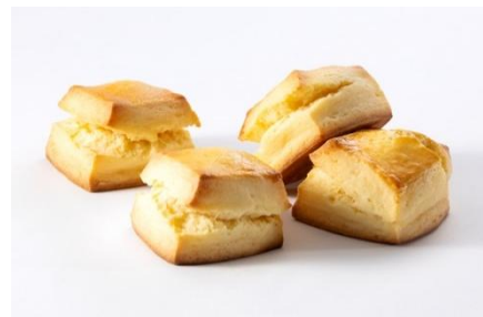
スコーン プレーン