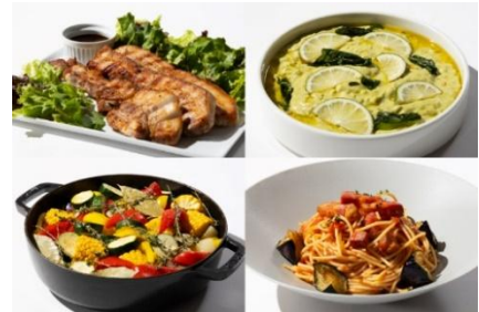
ランチバイキング