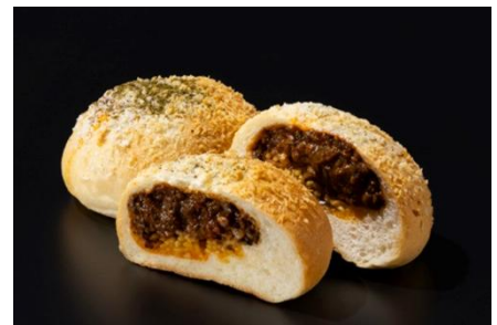
黒毛和牛挽肉の麻婆麺カレーパン

黒毛和牛挽肉の旨みと花椒の香りが広がる麻婆麺を包み込んだ一品。 ピリッとした辛味と奥深いコクが食欲を刺激する夏にぴったりの カレーパンです。