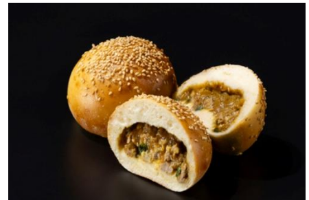
胡椒餅カレーパン

台湾の人気グルメ「胡椒餅」をイメージし、スパイスの香りと肉の旨みをカレーと融合させました。噛むたびに広がる香ばしさと刺激的な味わいをお楽しみください。