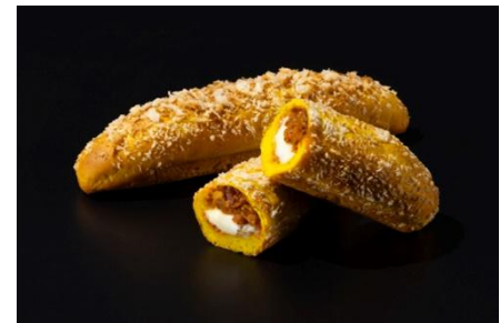
北海道産ベーコンと 3種茸のクリーミースティックカレーパン

北海道産ベーコンの旨みと3種類の茸の豊かな香りを閉じ込めた グラタン風フリングを、食べやすいスティックタイプに仕上げました。 まろやかな味わいと香ばしい生地が調和するカレーパンです。