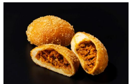
魚介のラグーとモzzarellaチーズのカレーパン

魚介の旨みを凝縮したラグーソースに、まろやかなモzzarellaチーズを合わせました。カレーのスパイスと魚介の風味が織りなす、奥行きのある味わいをご堪能ください。