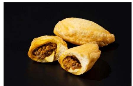
トマトキーマカレーと燻製モzzarellaチーズのパンツェロツティ風

トマトの爽やかな酸味を生かしたキーマカレーに、スモークしたモzzarellaチーズを合わせました。イタリアの包み揚げピッツァ「パンツェロツティ」をイメージした、香り豊かな洋風カレーパンです。