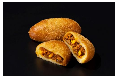
白老牛と北海道産とうもろこしの 無水カレーパン

上質な白老牛と甘み豊かな北海道産とうもろこしを使用し、 水を加えず素材の旨みだけで仕上げた贅沢なカレー。 北海道の恵みを存分に味わえるカレーパンです。