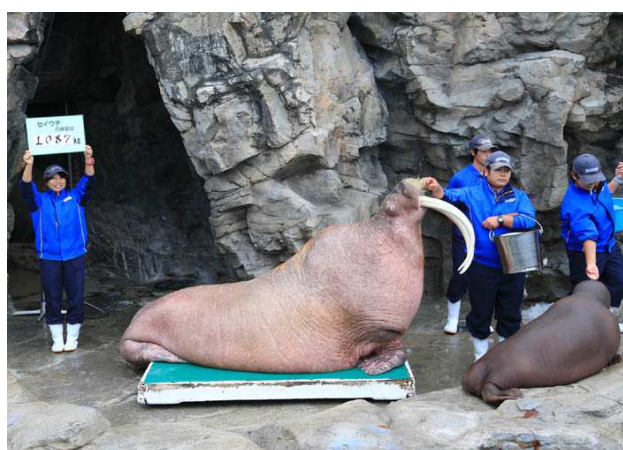
公開体重測定時の「タック」 （平成25年11月2日撮影）