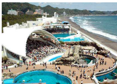
鴨川シーワールド 園内俯瞰