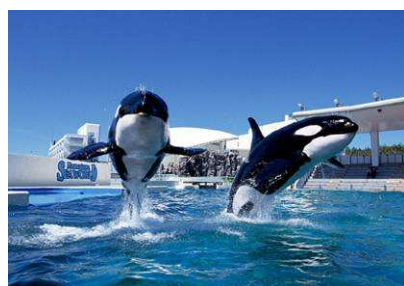
豪快なシャチパフォーマンス