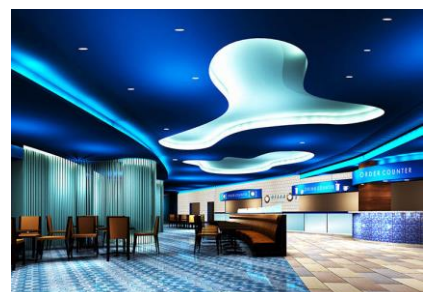
UNDERWATER(アンダーウォーター)