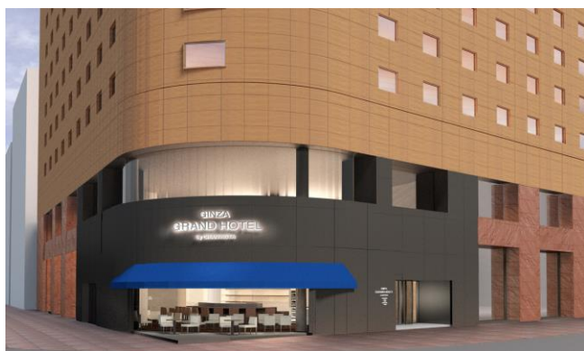
銀座グランドホテル外観(イメージ)

宿泊ゲストのみならず、地域のコンシェルジュとして、銀座の良いモノやコトを発信する取り組みです。そのためにホテルスタッフは、銀座の老舗店で銀座流のおもてなしを学ぶ「銀座 0JT」を実施し、自身の体験を基に、銀座の良さをしっかりとお伝えして参ります。