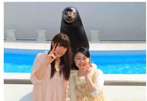
笑うアシカと記念撮影