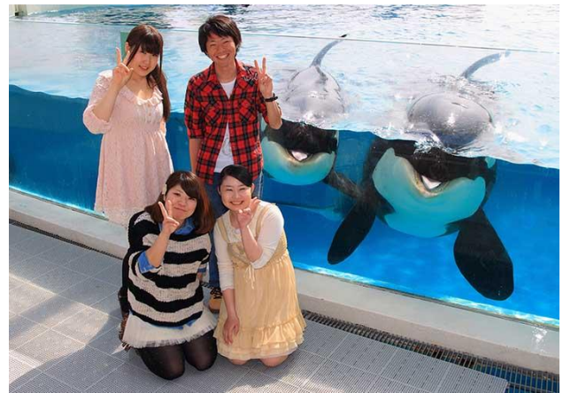
ガラス面前でのシャチと記念撮影