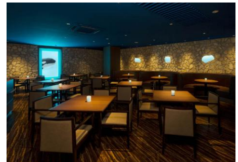
食事会場: レストランオーシャン内『the CAVE』