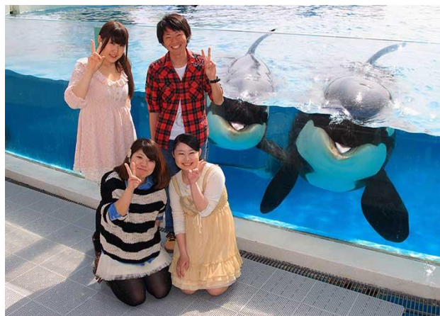
ガラス面前でのシャチと記念撮影(写真プレゼント①)