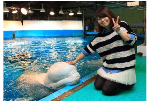
ペルーガにタッチ(写真プレゼント②)