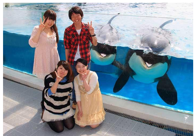
ガラス面前で、シャチと急接近しての記念写真