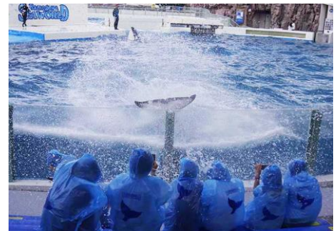
オリジナルポンチョでテールバースト体験