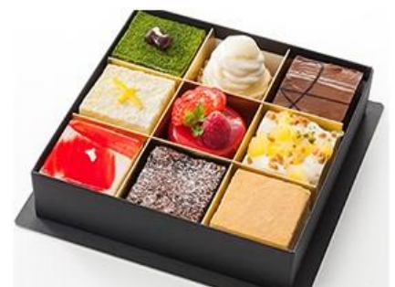
<ホリデースイーツボックス>