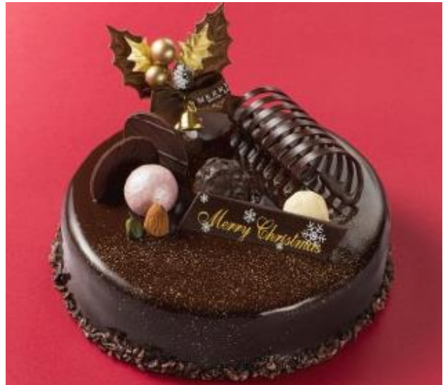
『スイートチョコレートケーキ』

コクのある生クリームと程よい甘さのいちごが織りなすハーモニーをお楽しみください。