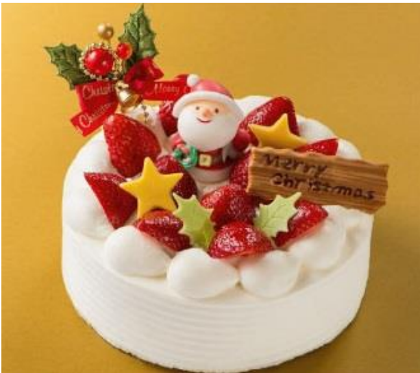
『いちごの生デコレーションケーキ』

ご予約・お渡し場所 1階ロビーラウンジ 06-6573-3204(ダイヤルイン)