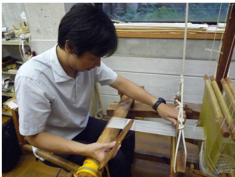
手機による機織り体験(イメージ)

5月は、京都市が指定する74品目の伝統産業の中より、普段工房でしか体験することのできない西陣織の伝統技法である錦織の伝統織物「手機による機織り体験」をはじめ、「京こま作り」や「裏千家の茶道体験」などの伝統文化をご用意しております。ぜひお気軽にお立ち寄りください。