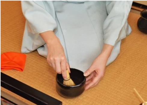
抹茶体験(イメージ)