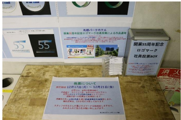
※2018年12月14日～12月21日ホテル内投票