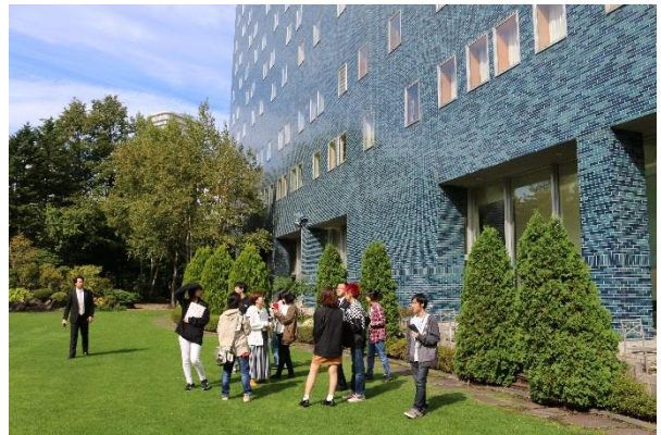
※2018年10月9日 ホテル館内見学会