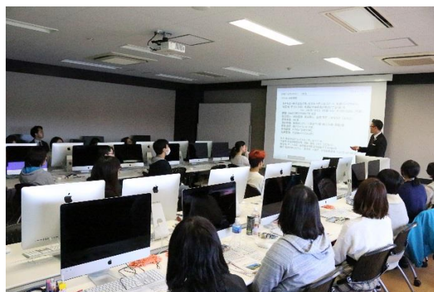
※2018年10月2日 専門学校の教室にてオリエンテーション

このプロジェクトは、ホテル開業 55 周年記念ロゴマーク制作という課題を、札幌放送芸術&ミュージック・ダンス専門学校の学生へ依頼することにより、学びの場を提供し、学校が進めている産学連携教育による人材育成「企業プロジェクト」にも協力する事で、記念すべき周年事業において重要な、地域への感謝を込めた社会貢献も果たせるとの考えからスタートいたしました。