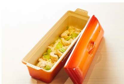
車麩と空豆のクリーム煮