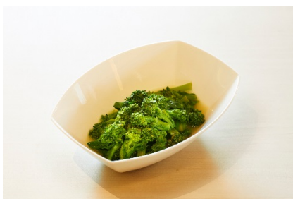
菜の花の辛し和え