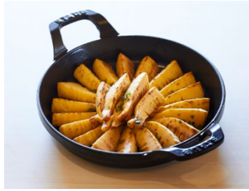
竹の子バターしょう油焼き