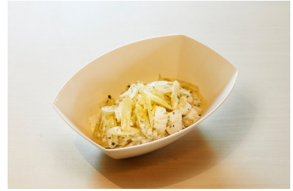
フキと豆腐のサラダ

【INTERGATE HOTELS コンセプト】 公式 HP: https://www.intergatehotels.jp/