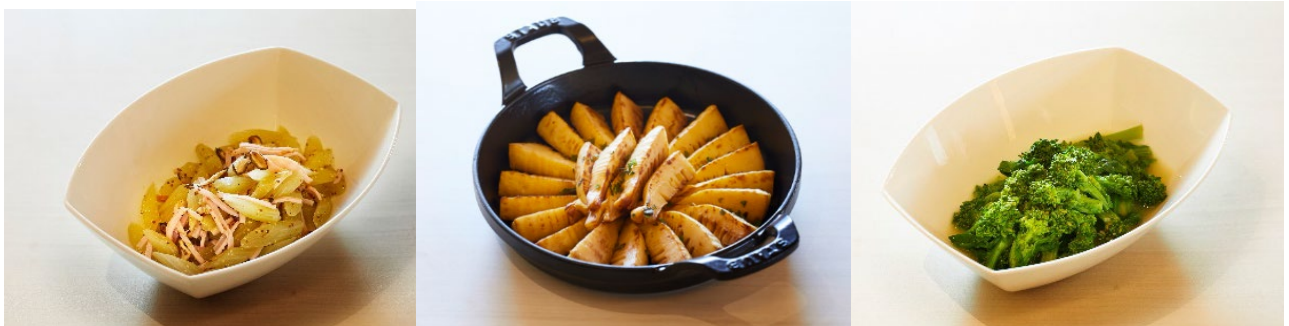
春メニュー例(写真はイメージです)

この春は、精進料理やお肉の代わりとしても使われる「車麩」を洋風にアレンジしたり、日本原産の山菜である「フキ」をサラダにしたりするなど、お客様にお楽しみいただける朝食メニューが登場。6 月中旬ごろまで、朝から春を堪能していただけます。