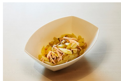
フキ・ハム・椎茸のサラダ