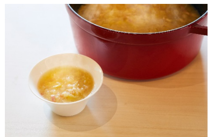
春キャベツとベーコンのスープ