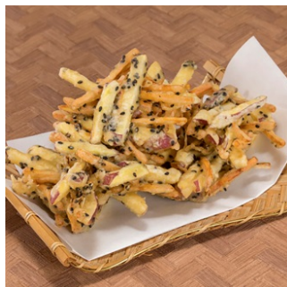
薩摩芋と人参の胡麻かき揚げ