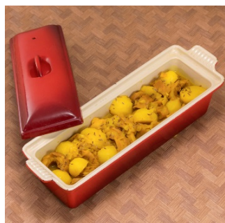
車麩とじゃがいものジンジャー、ターメリックの蒸し煮