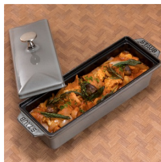
カリフラワーと車麩、椎茸のカチャトーラ風トマト煮