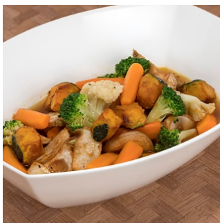
秋野菜の冷製スープカレー