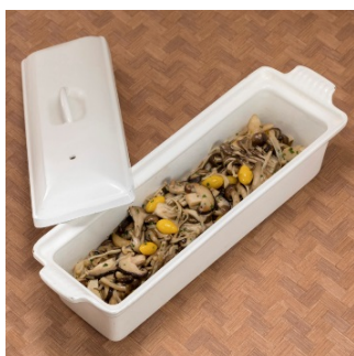
茸と銀杏のソテー