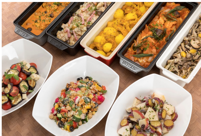
秋メニュー例(写真はイメージです)

様々な旬の野菜のおいしさを楽しめる“食欲の秋”。ひと手間加え、秋の旬の素材の旨みを引き出した“ごちそう野菜”の朝食メニューを、9月11日(水)より12月上旬までお楽しみください。