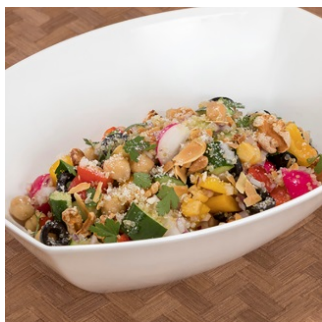
チョップドサラダ