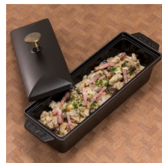
茸と鶏肉の白味噌クリーム煮