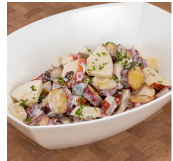
茸と薩摩芋・リンゴの秋サラダ インサラータ