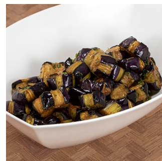
揚げ秋茄子のマリネバルサミコ酢風味

【INTERGATE HOTELS コンセプト】 公式 HP: https://www.intergatehotels.jp/