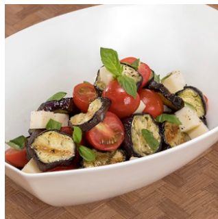
秋茄子・トマトとモッツァレラチーズの インサラータ