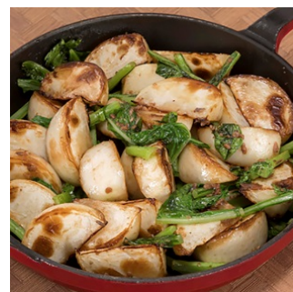
秋蕪のアンチョビ炒め