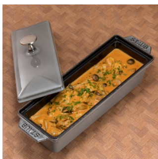
茸と鶏肉のクリーム煮カレー風味