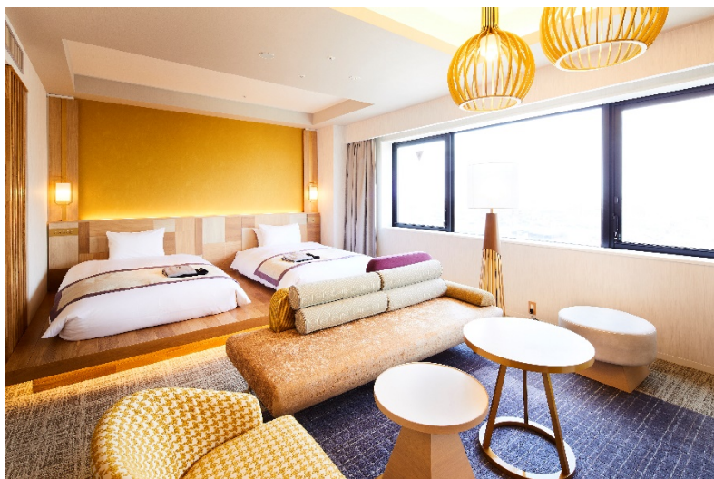
【ジュニアスイートルーム（47㎡）】

営業再開にあたり、お客様や従業員の安心・安全な環境をまもるため、「三密回避」「衛生管理」「従業員の健康管理」など、新型コロナウイルス感染症対策の基本方針に基づき、取り組んで参ります。尚、朝食を含む営業内容は当面の間、変更させていただきます。