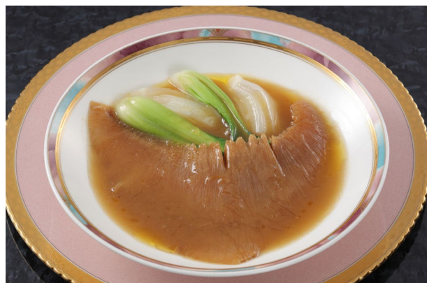
Go To トラベル！ 1泊2食付き宿泊プラン 中華四川料理「銀座 桃花源」ディナーコース（イメージ）

今回の『Go To トラベル！ 特別宿泊プラン ～ホテル生活を満喫～』では、ホテル内のレストランにて、朝食と夕食をご提供する1泊2食付き宿泊プラン、ベッドルームにリビングルーム、バスルームを備えた55㎡の広さのスイートルームをお得な料金でご利用頂けるスイートルームプランをご用意いたしました。また、10月19日（月）より、ホテルから徒歩圏内の築地場外市場「魚河岸食堂」の6店舗でご利用いただけるお食事券付き宿泊プランも登場いたします。駅から徒歩1分、好アクセスの当ホテルで、ぜひこのお得なこの機会に、日常の生活から離れて過ごすひとときをお過ごしください。