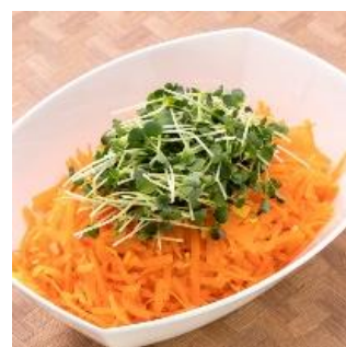
人参とかいわれ大根の レモンマリネ