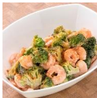
ブロッコリーとシュリンプの オーロラソース和え