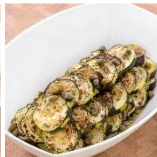
茄子とズッキーニの イタリアンマリネ