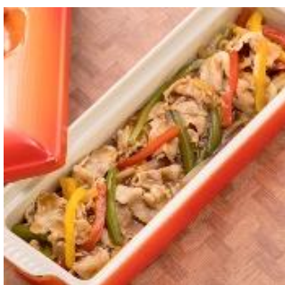
豚肉とカラフルピーマンの 黒酢餡