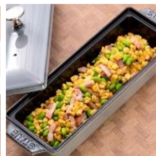
とうもろこしと枝豆の ベーコンソテー