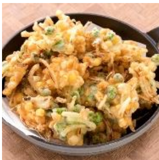
とうもろこしと 枝豆のかき揚げ