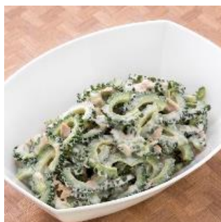
ゴーヤとツナのマヨネーズ和え