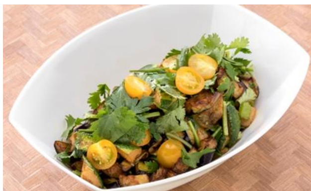
茄子とズッキーニのエスニックサラダ

コロナ禍で健康への意識がより高まっている今、これからの暑い季節を乗り切るのにぴったりな栄養素を豊富に含んだ夏野菜をふんだんに取り入れ、彩り豊かな夏限定メニューとしてご用意いたしました。