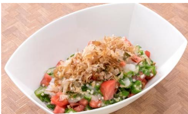
オクラとトマトのみぞれおほか

株式会社グランビスタ ホテル&リゾート（本社：東京都千代田区、代表取締役社長：須田貞則）が運営する、価値体験型ホテル『インターゲートホテルズ』では、シェフがひと手間加えた人気の「焼きたてパンとごちそう野菜の朝ごはん」に、一日の活力となる、栄養豊富な夏野菜をふんだんに使用した夏メニューが本年6月15日（火）より登場いたします。