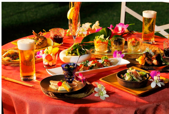
「Beer Garden エリア」イメージ

BBQ食材内容・・・季節の野菜盛合せ / 牛肉、鶏肉、豚スペアリブ、ソーセージ、ホルモン盛合せ/ 帆立貝、海老、イカの盛り合わせ