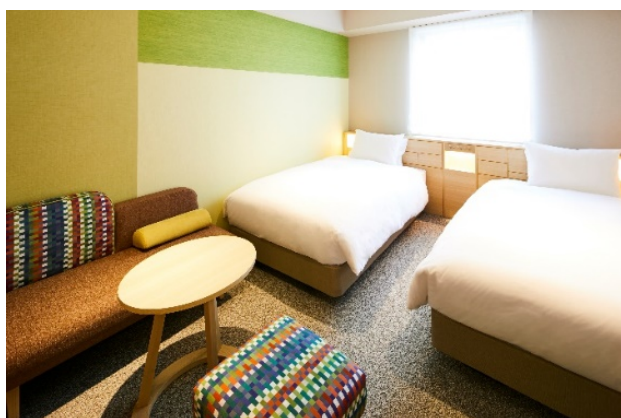
スーペリアツインルーム

～賞品～ 特別賞：ホテルインターゲート金沢 ペア宿泊券 3名様 スーペリアツインルーム 1泊（1室2名様）ご朝食付 副賞：加賀野菜セット 3名様