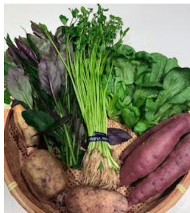
加賀野菜セット ※写真はイメージです。