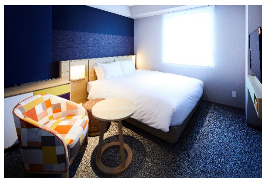
スタンダードダブルルーム

ご利用期間 : 2022 年 1 月 15 日 (土) ~ 2022 年 3 月 16 日 (水) まで ご利用価格 : スタンダードダブルルーム 平日 2 名様 1 室ご利用時、1 名様 4,137 円~ ※税・サ込・宿泊税別