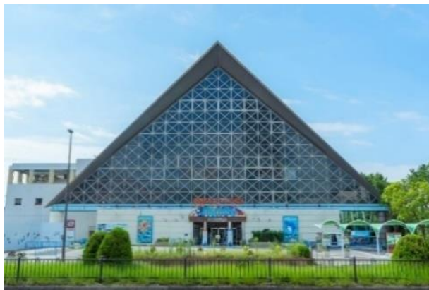
須磨海浜水族園 外観

本パスポートは購入日より営業終了の2023年5月31日（水）まで何度でも水族園をご利用いただける、フリーパスポートです。営業終了まで最後の1年となりますが、「ありがとうをもっと これからもずっと」をテーマにこれまでの感謝の気持ちを込めた様々な企画を実施いたします。皆様のご来園をお待ちしております。